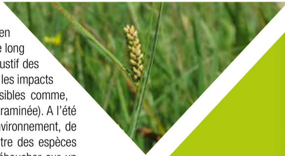
LA LAÏCHE À ÉPIS NOIRS : Flore protégée au niveau régional.